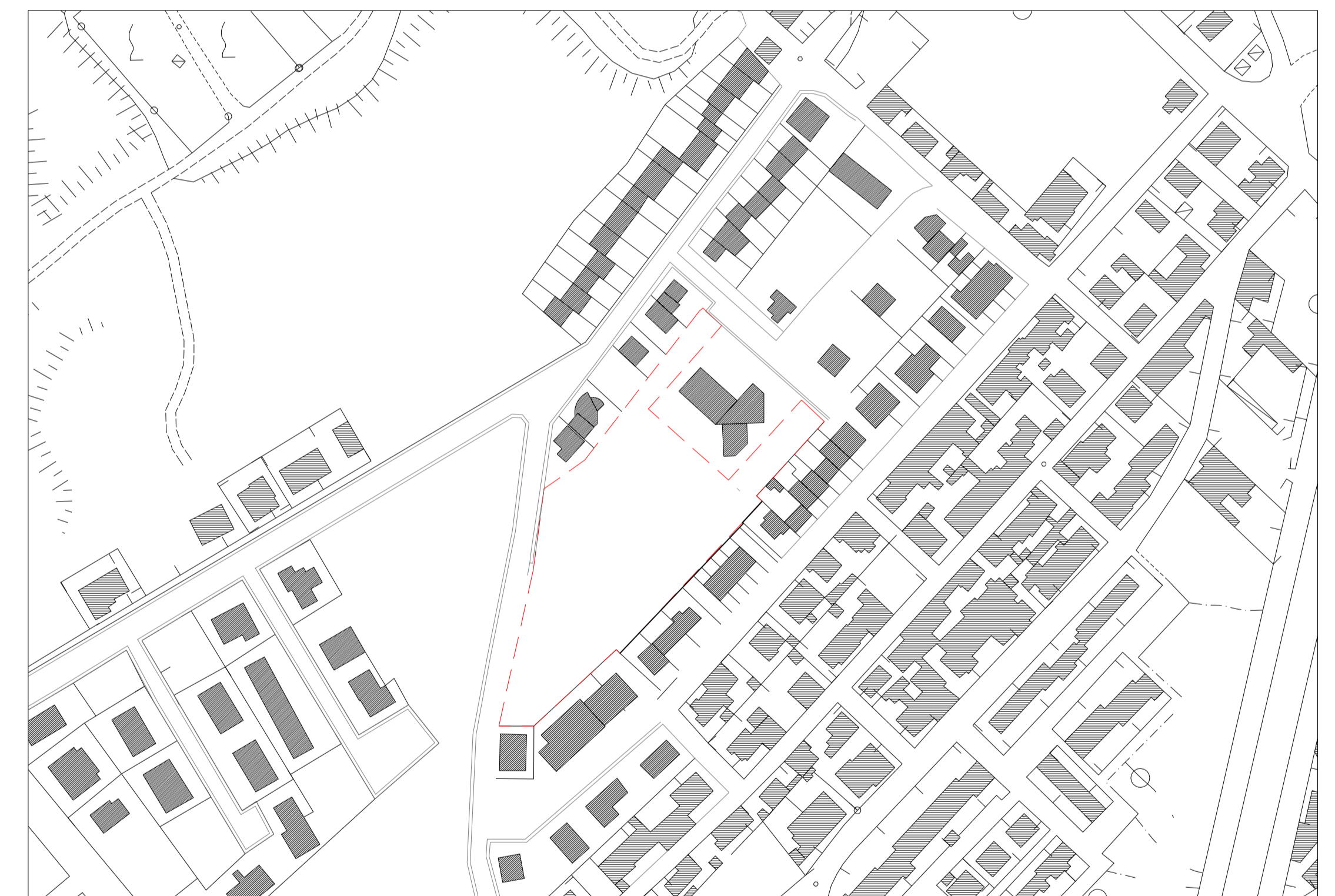
Stralcio CTR con indicazione area d'intervento scala 1:2000