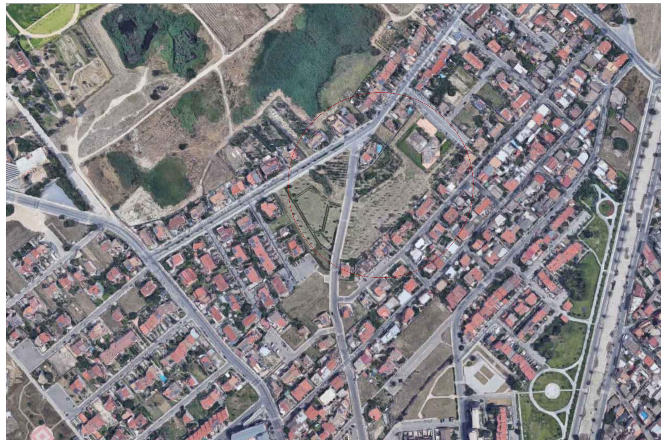
Ortofoto con identificazione area d'intervento